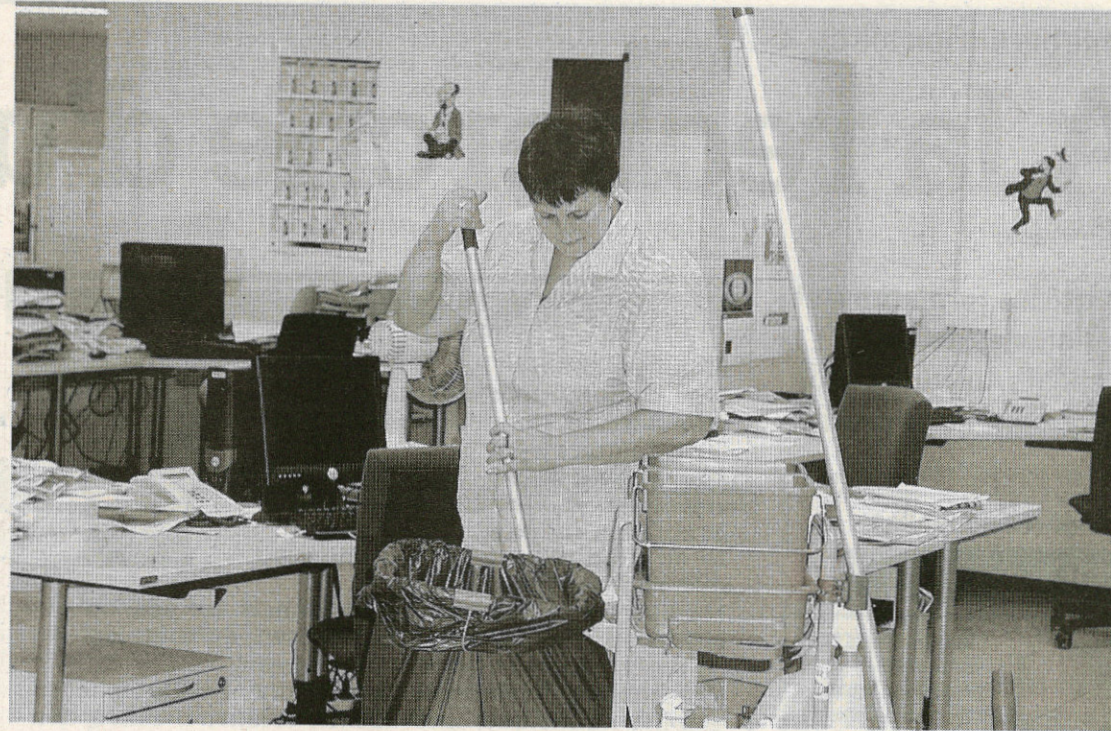
En entreprise, le travail se fait souvent en dehors des heures de bureau, soit tôt le matin ou tard le soir. □

Chez un particulier, le nettoyeur, qui est dans une très grande majorité des cas une nettoyeuse, travaille en journée, avec peut-être des produits différents chez chacun de ses